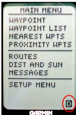
Hauptmenü: rechts unten "D" für das Diagnosemenü anwählen