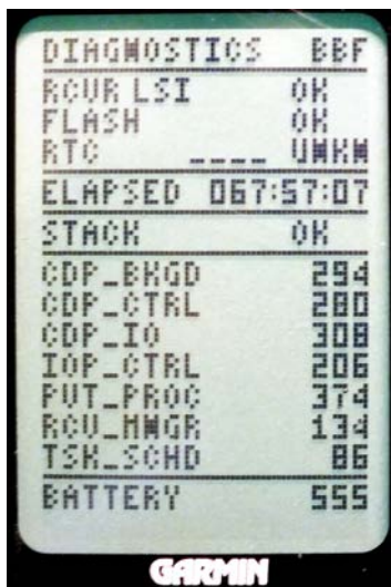
Diagnosemenü - zeigt geräterelevante Daten an